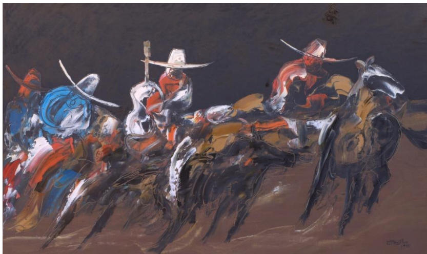
Ilton Silva, acid Lida de peão 100 x 60 cm. Óleo sobre Tela 1995

Estado de origem. O fato de, no Catálogo, ter sido reproduzida a foto da expressiva tela A luz e o cavalo , de 1982, ausente na mostra, é mais outra ocorrência insólita e inexplicável.