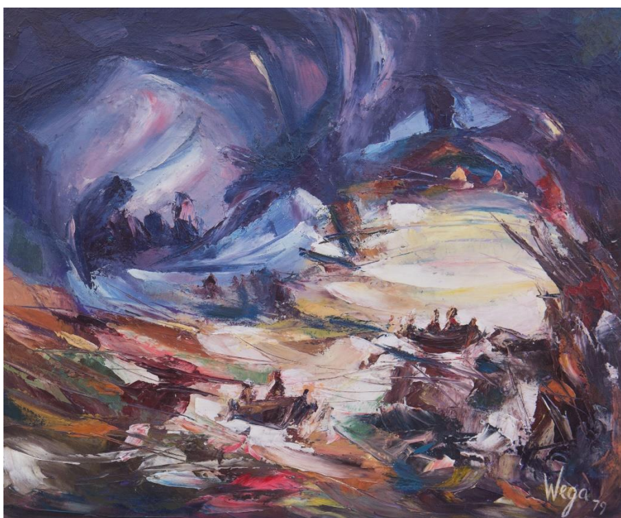
Wega, acid Barcos 50 x 60 cm. Óleo sobre Tela 1979

de Arte Moderna, em 1957; Prêmio Aquisição na VII Bienal de São Paulo, em 1963, e Prêmio Amistad Artística Americana na II Bienal Americana de Arte de Córdoba, Argentina, em 1964. Em 1963 teve uma Sala Especial na VII Bienal de São Paulo, o que se repetiu na décima primeira e na décima segunda versões do mesmo evento, nos anos de 1971 e 1973. Se já participara de diversas coletivas, até então, desde 1955 começou a expor individualmente em galerias das principais cidades do Brasil. De 1965 em diante, por meio de mostras individuais, seu talento passou a ser conhecido e reconhecido em centros internacionais como Montevideú, Buenos Aires, Washington, Nova York, Paris, México, Munique e Londres. Suas telas se fazem presentes em expressivas galerias do mundo, nas mais importantes coleções particulares do Brasil e circulam, sistematicamente, nos mais concorridos leilões de arte do País.