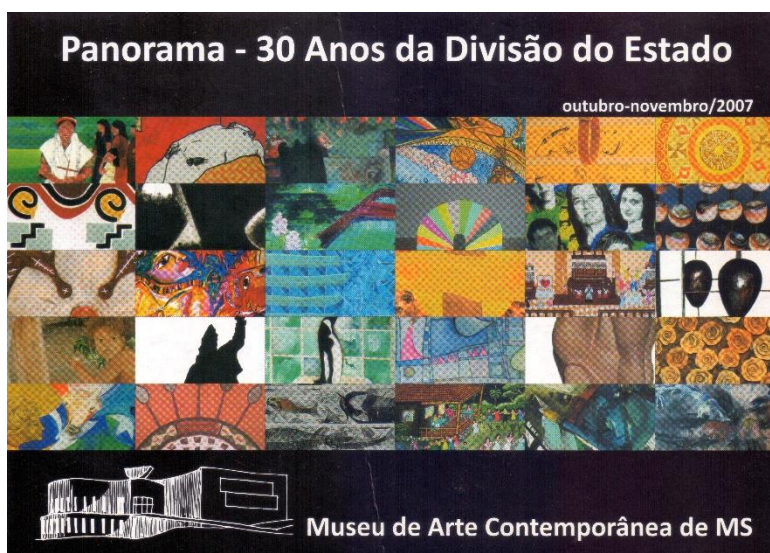
Frente do convite da mostra Panorama - 30 anos da divisão do Estado

Com o título Panorama - 30 Anos da Divisão do Estado , O Museu de Arte Contemporânea de Mato Grosso do Sul - MARCO, incluiu em sua programação uma mostra de artes plásticas que procura "refletir" o "processo de modelação contínua da identidade plástica sul-mato-grossense". A curadoria "formatou a mostra em quatro módulos: artistas da tradição, geração anos 80, geração anos 90 e artistas a partir do ano 2000." (PANORAMA, 2007, n.p.) Logo, é anunciada a preocupação de construir um painel geral das artes plásticas nos trinta anos de existência de Mato Grosso do Sul.