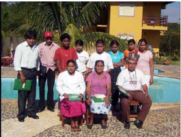
Figura 2. Pousada em Bonito. Grupo Kinikinau no Seminário “Povo Kinikinau: Persistindo a resistência”