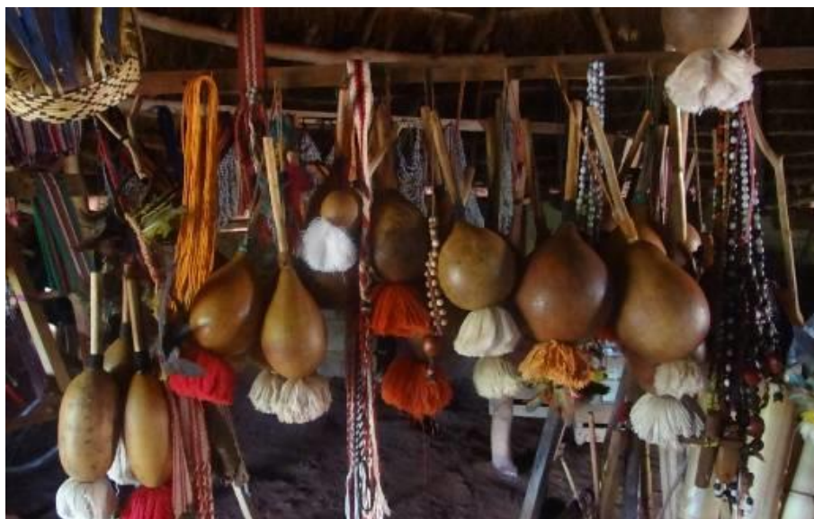
Figura 9 - Chocalhos confeccionados pela artesã Marilda Duarte. Matérias-primas: cabaça, linha e madeira