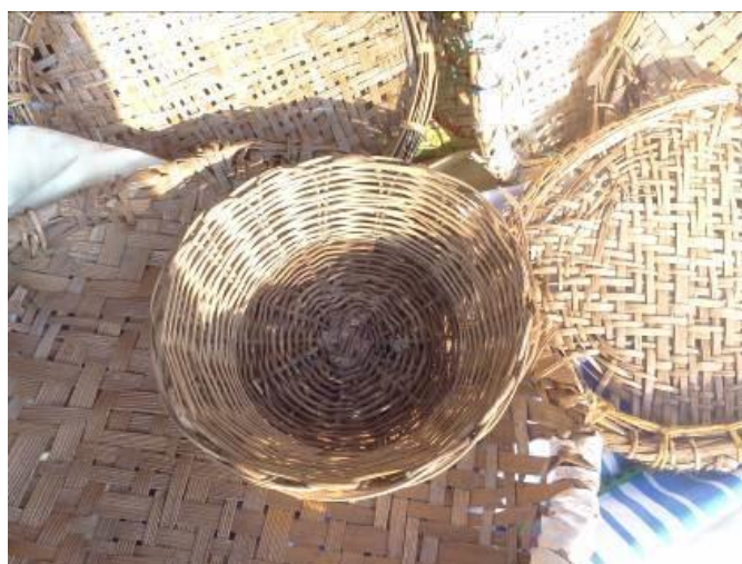
Figura 1 - Peneiras e cesto confeccionados pela Artesã Antônia Aparecida. Matérias-primas: fibra de palmeira e taquara

Atualmente, os trançados produzidos pelos Guarani da Reserva Indígena de Dourados se resumem a poucos objetos: os abanos para atizar o fogo, as peneiras e os cestos.