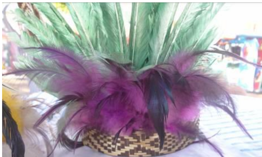
Figura 8 - Cocar confeccionado pela artesã Antônia Aparecida. Matérias-primas: penas coloridas, taquara e cipó