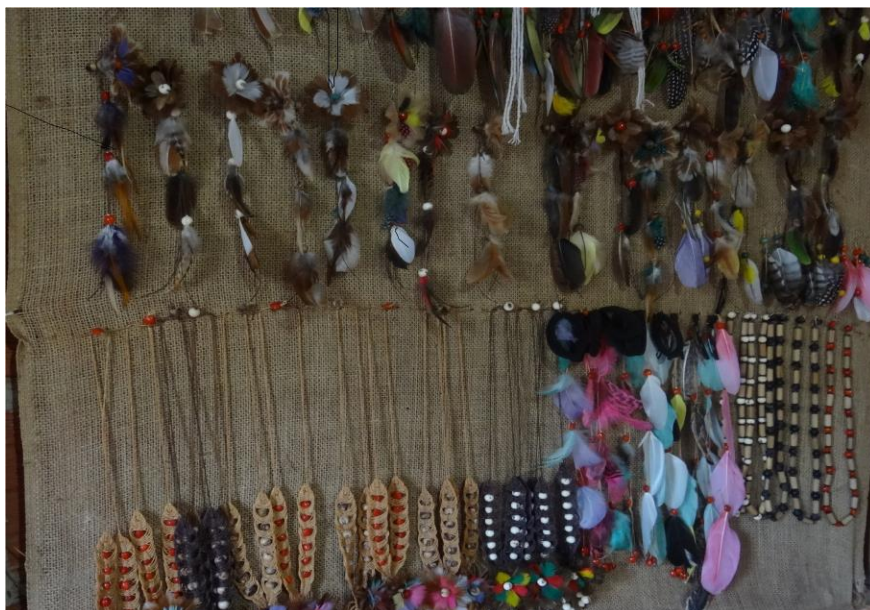
Figura 7 - Brincos e colares confeccionados pela artesã Claudia Nunes. Matérias-primas: penas coloridas, sementes nativas e barbante