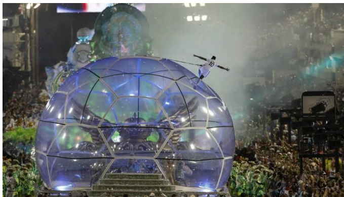
Figura 4 - Carro Alegórico Pelé da Escola de Samba Grande Rio.

Desde fins do século XX até os dias de hoje, a articulação das agremiações carnavalescas com a classe dominante e com políticos instalados no poder permitiu o controle da festa para atender às exigências ditadas pela modernização. Atualmente, em especial no Rio de Janeiro, os barracões das escolas de samba trabalham como linha de produção de uma moderna fábrica. Softwares sofisticados garantem carros alegóricos com estruturas mais leves e resistentes, enquanto o computador controla os efeitos luminosos que encantam o público no sambódromo. É um exemplo o carro alegórico eletrônico “Pelé” (Figura 4), da Escola de Samba Grande Rio, exposto no desfile de 2016.