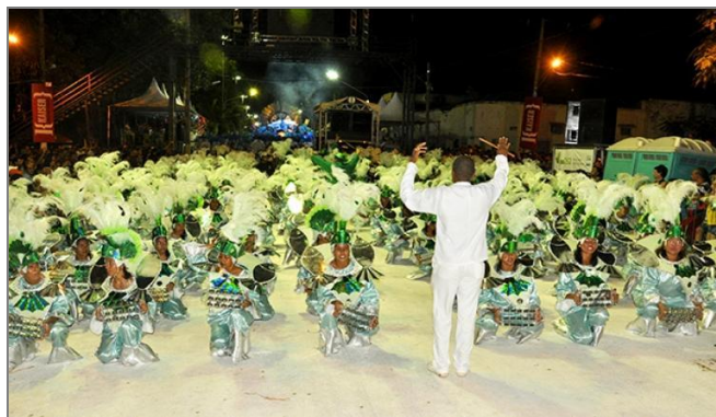
Figura 5 - Bateria da Escola de Samba Mocidade Independente de Corumbá, Mato Grosso do Sul.

[...] as escolas de samba brasileiras são conhecidas pela forma com que seus tambores são tocados, pelo ritmo que se dá aos corpos dos passistas e dos carros alegóricos. Cada escola tem características específicas que indicam o tipo de arranjo musical que a bateria apresenta, algumas enfatizam os agogôs, outras os surdos e a cuíca, por exemplo. Durante o desfile, a bateria faz duas paradas em locais chamados recuos, uma espécie de espaço vazio que permite a passagem da escola. Quando isso acontece vibra no corpo dos foliões e o samba apela para o movimento e a dança fazendo os corpos balançarem. (PRESTES FILHO, 2002, p. 94).