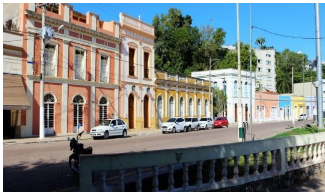
Figuras 2 - Casario do Porto, Corumbá, Mato Grosso do Sul.

A alfândega de Corumbá, além de receber e expedir mercadorias de consumo para todas as cidades do interior, também controlava uma boa parte do fluxo de produtos destinados ao oriente boliviano. Esse movimento comercial fez a grandeza das casas comerciais corumbaenses, cujas edificações hoje constituem o Casario do Porto (Figuras 2 e 3) (ALVES, 2005)