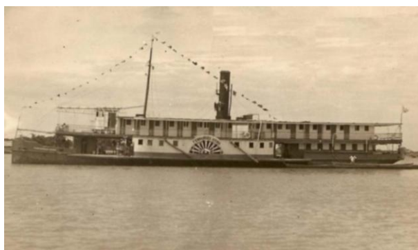
Figuras 7- Navio a vapor Fernandes Vieira a bombordo, no Rio Paraguai, Corumbá, Mato Grosso do Sul.

Outro exemplo da consagração do símbolo local foi a representação do lendário Vapor Fernandes Vieira (Figuras 7 e 8), emblemático da navegação no Rio Paraguai (PROENÇA, 1992).