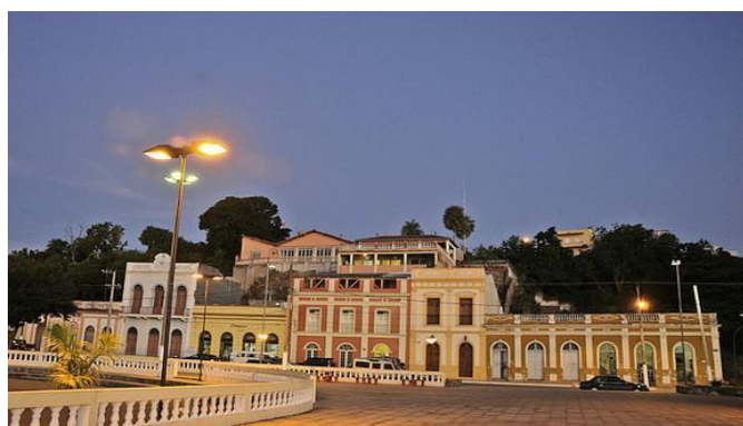
Figuras 3 - Casario do Porto, Corumbá, Mato Grosso do Sul.

A partir de 1914, o comércio fluvial sinalizou sintomas da decadência. A instauração da Estrada de Ferro Noroeste do Brasil (NOB), que atrelou a economia de Mato Grosso a São Paulo, possibilitou que o fluxo de mercadorias se desviasse para o eixo econômico São