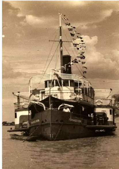
Figuras 8 - Navio a vapor Fernandes Vieira a bombordo, no Rio Paraguai, Corumbá, Mato Grosso do Sul.