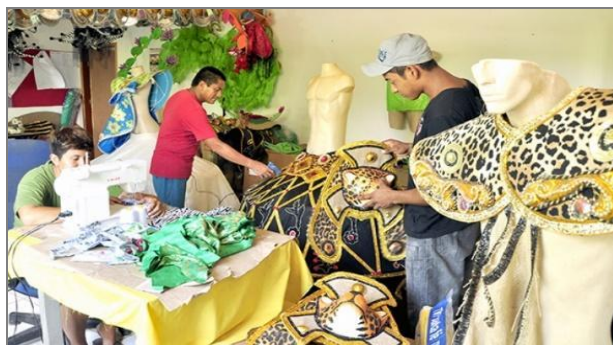
Figura 6 - Aderecistas carnavalescos de Corumbá, Mato Grosso do Sul.

No ano de 1985, a fauna e a flora pantaneira foram exaltadas nos desfiles das escolas de samba em Corumbá. Nos enredos das escolas de samba, nos carros alegóricos e nos adereços usados no desfile festivo, o Pantanal foi cantado como símbolo de qualidade ambiental. Essa tendência se difundiu e continua sendo reiterada. Os símbolos locais têm sido exibidos nas fantasias. A Figura 6 mostra fantasias estampadas com o padrão da pele de onça pintada, animal pantaneiro emblemático por estar no topo da cadeia alimentar e habitar o imaginário do homem como expressão de força.