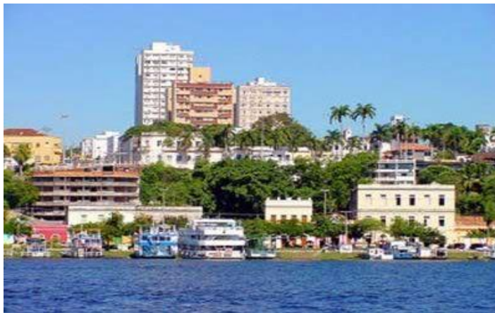
Figura 1. Corumbá, Mato Grosso do Sul.

Há registros históricos sobre a região que remontam ao século XVI, quando expedições espanholas atravessavam a planície pantaneira em busca de caminhos que as conduzissem às minas de prata do Peru. De acordo com Souza (1973), a região foi, no século XVII, percorrida pelas Bandeiras paulistas. Buscavam capturar indígenas de diferentes etnias para escravizá-los no serviço das lavouras do litoral brasileiro.